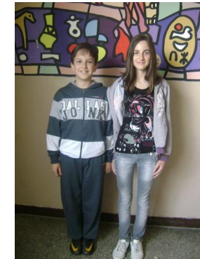
Награђени на конкурс „Стефан Гецев“