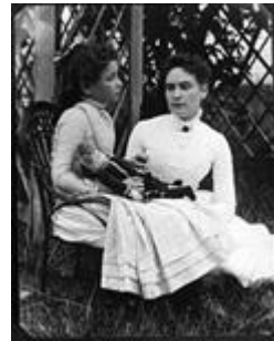
Хелен Келер са Аном Саливан

Иако је била слепа, глува и нема завршила је школу, написала неколико књига, јавно говорила о различитим важним темама, дружила се с највећим именима свог доба и ушла на званичну листу нај – значајнијих лица 20. века.