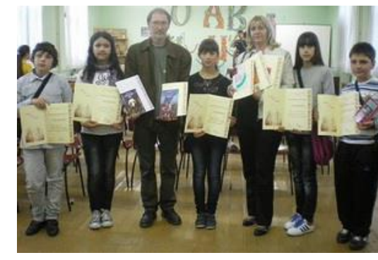
Смотра ћириличне писмености - Тител