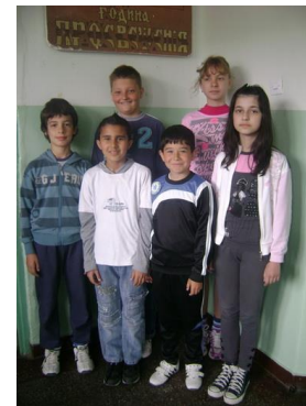
Похваљени на окружном такмичењу из математике