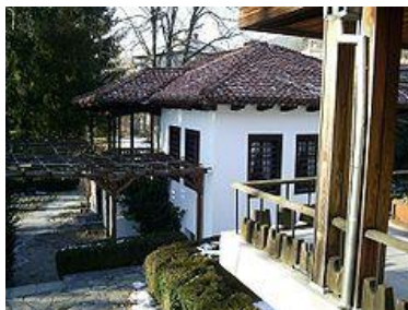
Родният дом на Христо Ботев в Калофер

СЛЕД избухването на въстанието в Босна и Херцеговина Ботев започва подготовката на въстание и в България. През май 1876. г. Ботев започва дейност за организиране на чета, става неин войвода. На 1. јуни 1876. година е последният тежък бой — привечер след сражението куршум пронизва Ботев. Това се случва в подножието на връха Камарата в Стара планина.