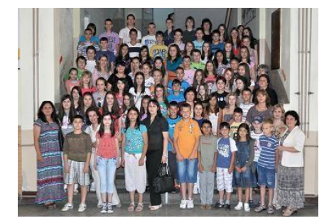
Најуспешнији такмичари 2011/2012