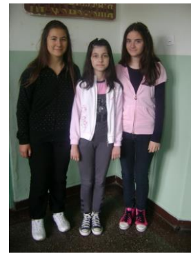
III место на окружном такмичењу из српског језика